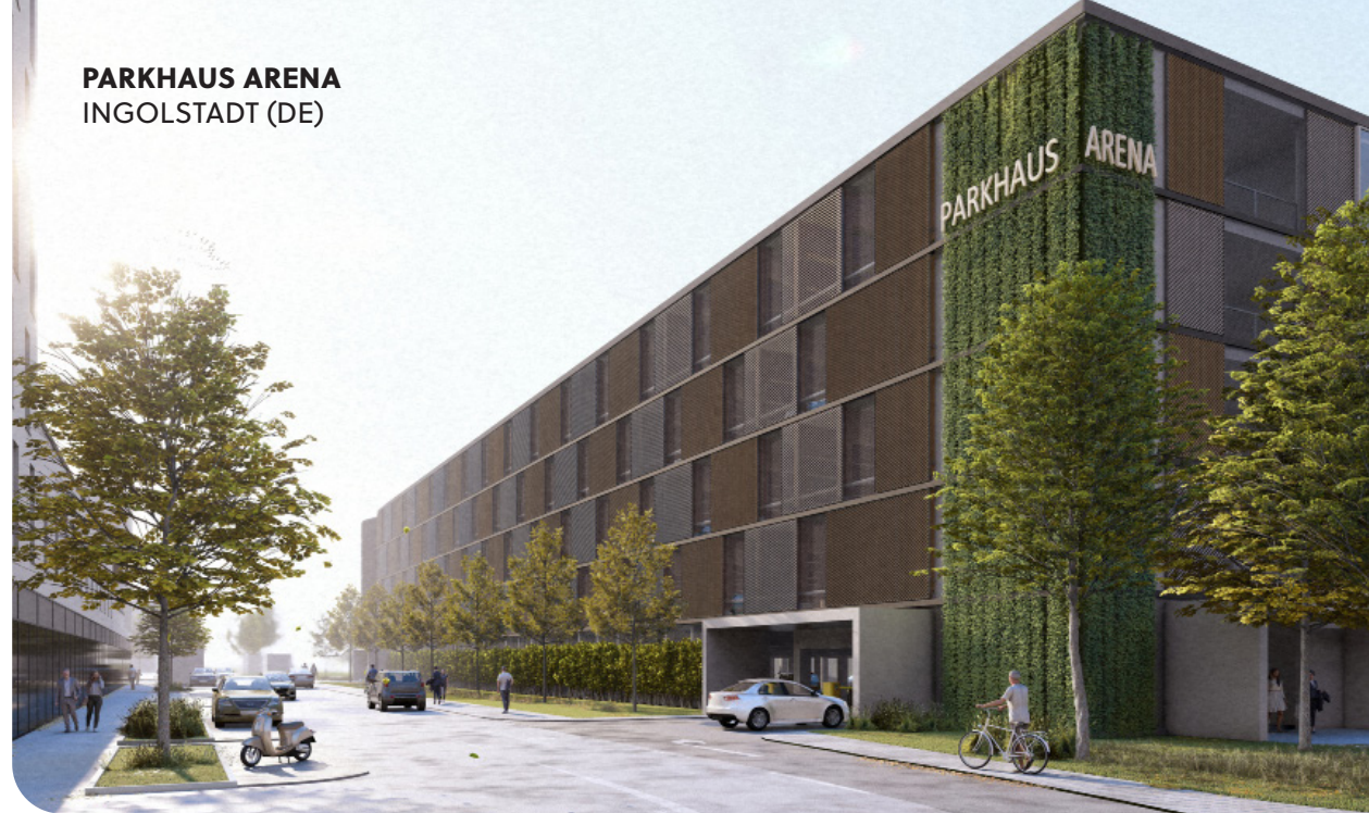
PARKHAUS ARENA INGOLSTADT (DE)

Weniger parkende Autos schaffen Platz für Grünflächen, Begegnung und urbanes Leben.