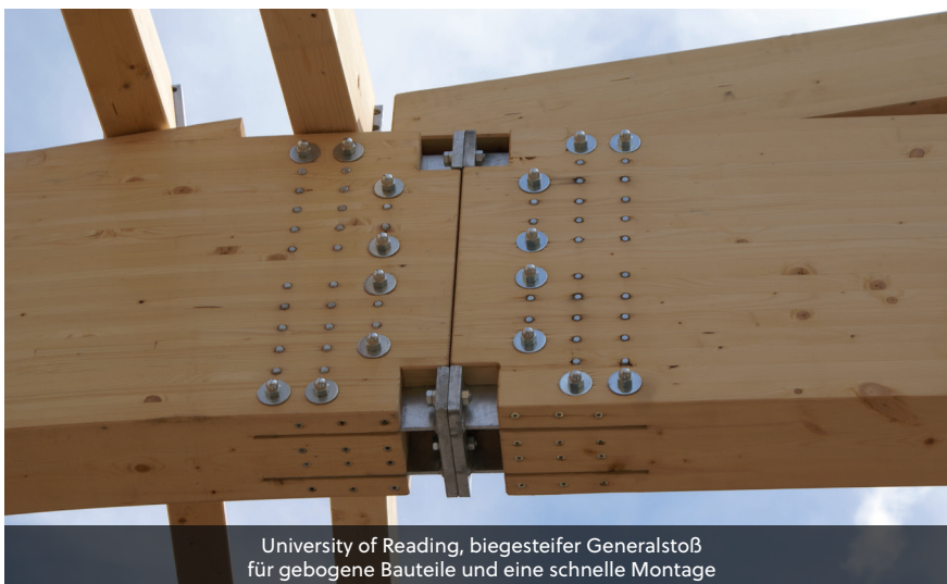
University of Reading, biegesteifer Generalstoß für gebogene Bauteile und eine schnelle Montage