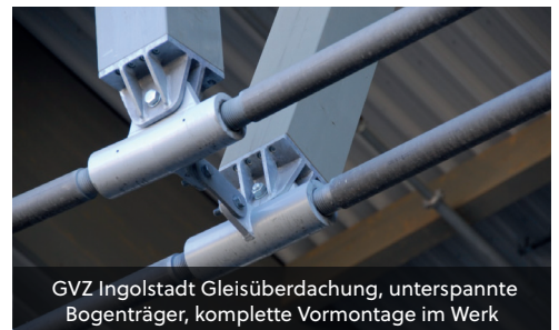
GVZ Ingolstadt Gleisüberdachung, unterspannte Bogenträger, komplette Vormontage im Werk