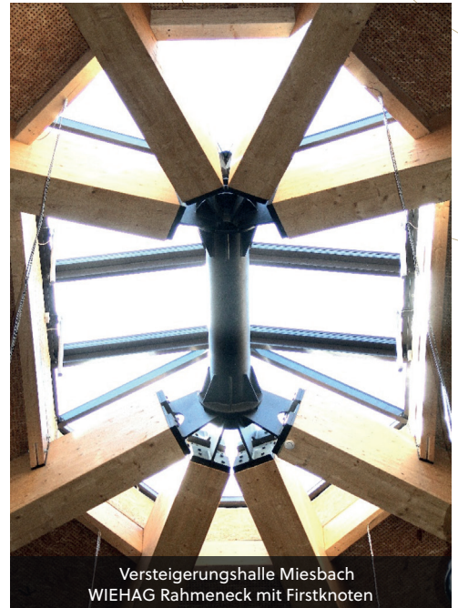
Versteigerungshalle Miesbach WIEHAG Rahmeneck mit Firstknoten