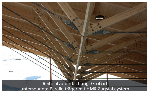
Reitplatzüberdachung, Großarl unterspannte Parallelträger mit HMR Zugstabsystem