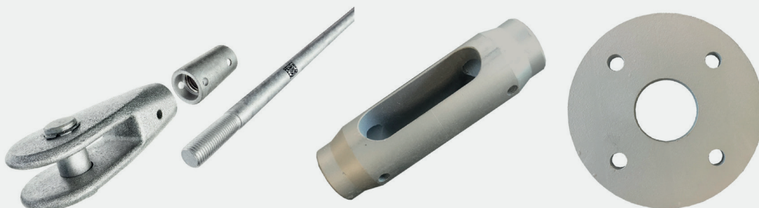
HMR-Zugstabsystem mit Kreuzmuffe und Kreisscheibe