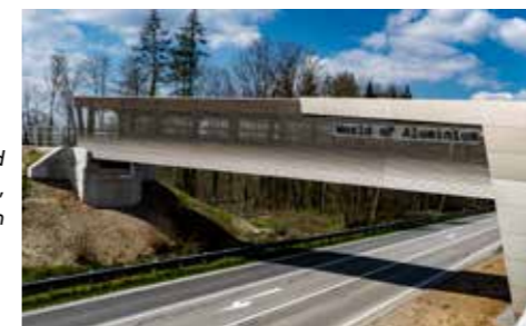
AMAG Rad- und Fußgängerbrücke, Ranshofen