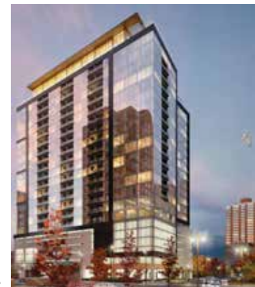
Ascent Tower, Milwaukee