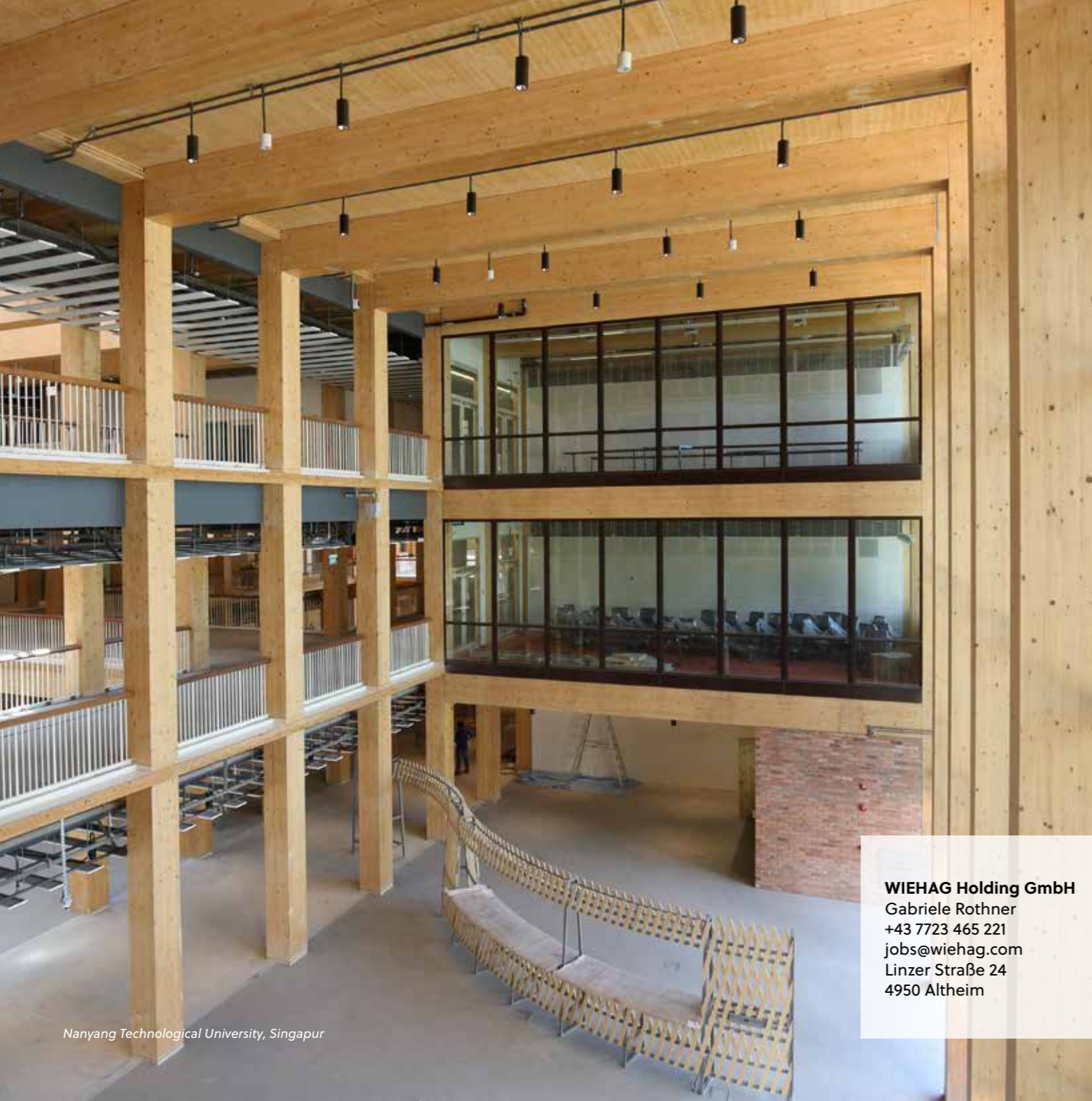
Nanyang Technological University, Singapur