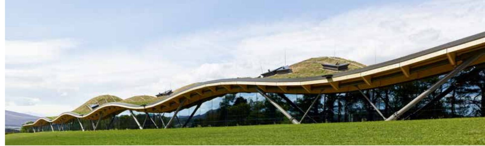
Macallan Distillery, Schottland