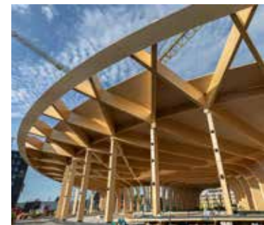
World of Volvo, Göteborg

Wir legen Wert auf die Nachhaltigkeit der Wertschöpfungskette: vom Waldbestand, über das forstliche Management, Holztransport und Produktionsprozess bis zum fertigen Produkt. Unser Unternehmen in der fünften Generation baut auf über 170 Jahre Erfahrung im Holzbau. Die Kultur unserer Zusammenarbeit ist von Offenheit, Wertschätzung und Vertrauen geprägt.